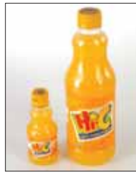
Kullanılmış PET şişeler saf malzemenin yerini 1:1 oranında alabilecek bir hammadde seçeneğidir. Petcore’a göre bugünlerde kullanılan PET şişelerin % 15’i zaten yeni şişelere ekleniyor. Kalanı da diğer malzemelere dönüştürülüyor.

Plastikten yapılan modern ambalaj çözümleri sayesinde daha fazla ürün taşınabiliyor. Nakliye alanı verimli kullanılabiliyor ve nakliye esnasında harcanan yakıt miktarı azalıyor. Ekolojik denge iyiyi gidiyor.