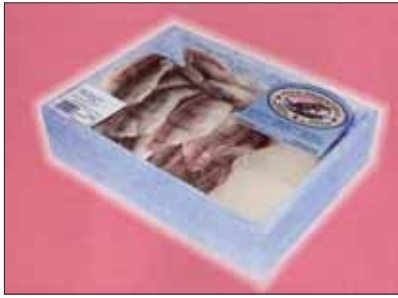
Plastik ambalaj balığı uzun süre buz gibi soğuk tutar.

Baştan sona soğutma zinciri sağlamak için sert (rijit) plastik bir malzeme olan PS (polistiren) köpükten yapılmış ambalaj kullanılabilir. Bu malzemeye istenen şekil verilebilir. Bu plastik kapların dara ağırlığı aynı boydaki ahşap kasalardan çok daha azdır – bu da nakliye ağırlığını ve yakıt tüketimini olum yönde etkileyen bir husustur. Plastik kapların ısı yalıtım özellikleri idealdir ve enerji-yoğun soğutma ihtiyacını en aza indirerek önemli oranda elektrik tasarrufu sağlar. Doğal olarak, yüksek performanslı plastik ambalaj tekrar tekrar kullanılır ki bu da çevrenin aktif biçimde korunmasına diğer bir katkıdır.