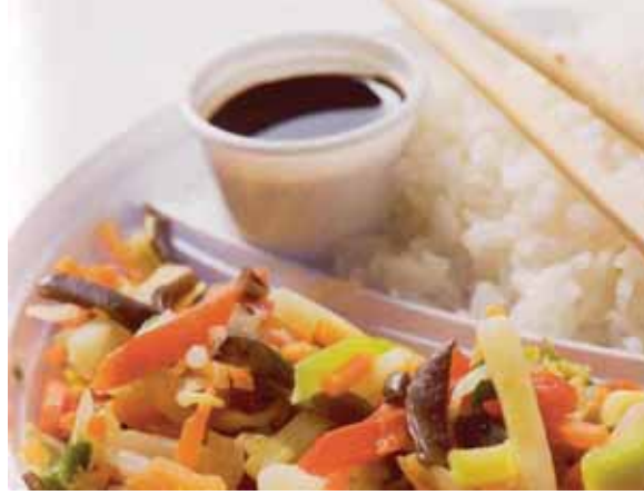
Plastik ambalaj soğuktan korur ve besinleri sıcak tutar.